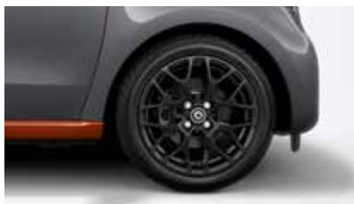
16-palčna (40,6 cm) črno lakirana platišča iz lahke kovine s osmimi Y prečkami s pnevmatikami 185/50 R16 spredaj in 205/45 R16 zadaj