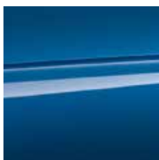
polnočno modra (metalik) [EDDO]