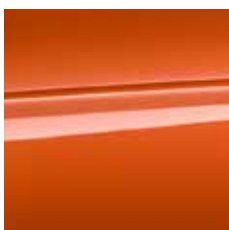
lava oranžna (metalik) [EDBO]