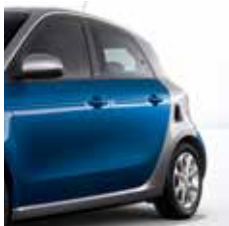
hladno srebrna (metalik) [ER2U]