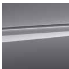
grafitno siva (metalik) [EDCO]