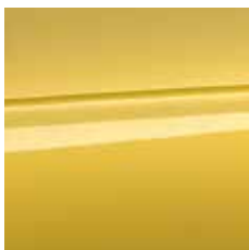
črno rumena (metalik) [EDFO]