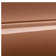
lešnikovo rjava (metalik) [EBBO]