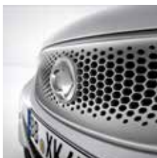
hladno srebrna (metalik) [4U8]