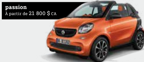
passion À partir de 21 800 $ CA