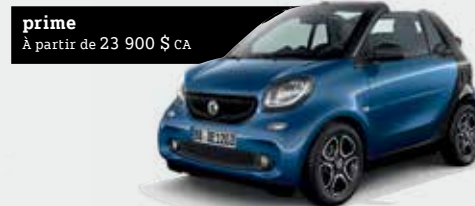
prime À partir de 23 900 $ CA